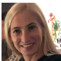
Frances Keiler Rahmenprogramm

T. +43 699 152 470 06 E. astrid.weigelt@goldstern.at